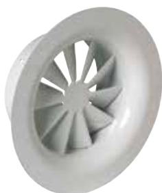
SR 861 F0 D315 (c31) RAL9010-85%

Le SR 861 est un diffuseur fixe à haute induction à jet d'air hélicoïdal pour la diffusion d'air dans les bâtiments tertiaires.