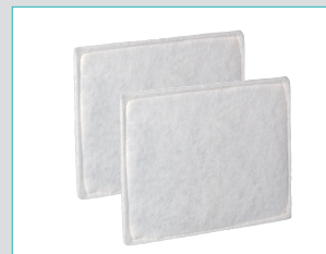
Filtres de rechange 2 G4 (11023220)