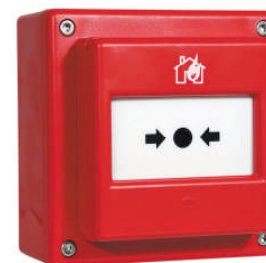
DMMD ET Rouge