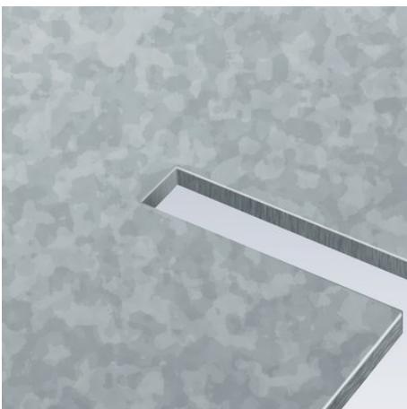
Découper et briser les copeaux en une seule opération

Sous réserve de toute modification technique et erreur.