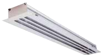
Diffuseur ALD 610 - 620

Le ALD 610 - 620 est un diffuseur linéaire en aluminium à fentes fixes pour la diffusion ou la reprise d'air dans les bâtiments tertiaires.