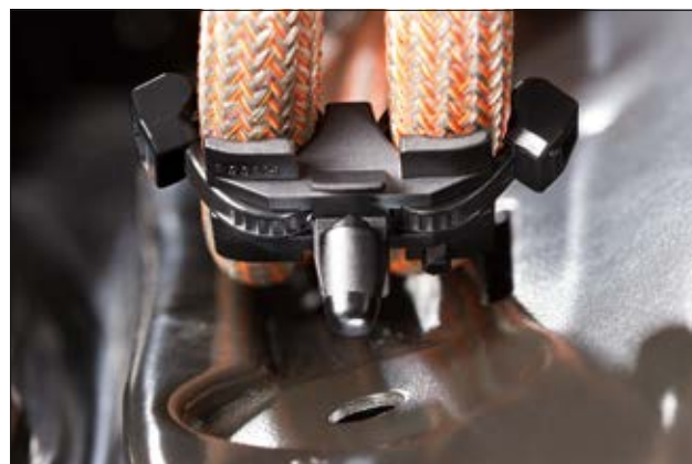
Lanière T50SOSDSFT6.5 pour un routage en parallèle des câbles.