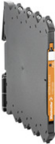
Illustration du produit, Similaire à l'illustration