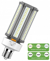
145790 LED Corn Switch E40 36W-54W 4800-7800lm 3000K-5000K