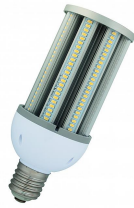
80100036334 LED Corn HOL E40 36W 4860lm 3000K