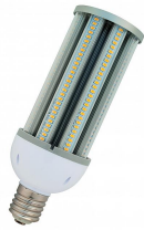
80100036297 LED Corn HOL E40 45W 6400lm 4000K