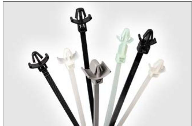
Assortiment de lanières monoblocs à pied ancre avec ailettes.