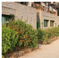
5 Mât en fibre de verre