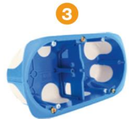
Installer le séparateur