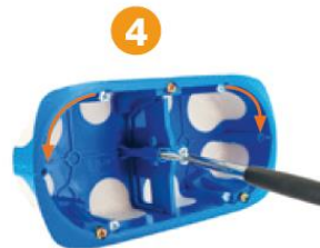
Placer les vis d'appareillage jumelées sur les puits du séparateur et modifier l'implantation des vis d'appareillage. Visser.

Accessoire «Vis d'appareillage jumelées» code 680710 À utiliser pour la pose de certains appareillages à l'horizontale