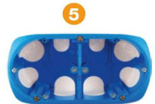
Le séparateur est verrouillé, les appareillages horizontaux peuvent être installés.

Un séparateur CF/Cf (sans vis) livré avec chaque boîtier.