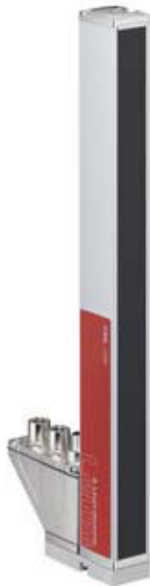
Figure pouvant varier