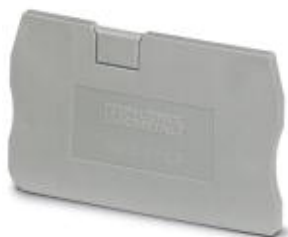
Flasque d'extrémité, Longueur: 48,6 mm, Largeur: 2,2 mm, Hauteur: 29,1 mm, Coloris: gris

Remarque : les données indiquées ici sont tirées du catalogue en ligne. Vous trouverez toutes les informations et données dans la documentation utilisateur. Les conditions générales d'utilisation pour les téléchargements sur Internet sont applicables. ( http://phoenixcontact.fr/download )