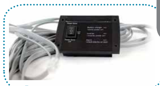
■ Option commande à distance

Les CS+DIF sont également dotés de nombreuses fonctions indispensables au bon fonctionnement de votre système : Mode Veille, Courant de charge ajustable, Tension de coupure batterie et plage d'entrée 230V réglable.