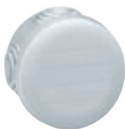
0 920 01

avec embouts à entrée directe, IP 55 - IK 07 - 650 °C