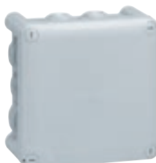
0 920 32

avec embouts à entrée directe, IP 55 - IK 07 - 750 °C