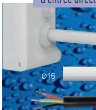
Permettent l'entrée directe des tubes IRL jusqu'à Ø16 et des câbles R02V

Blanc ou gris, avec embouts à entrée directe