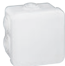
0 920 13