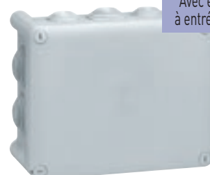
0 920 52