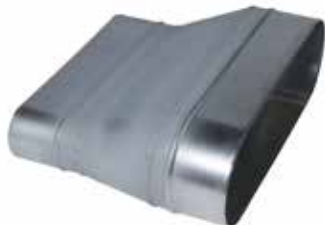
Réduction Oblongue Tangentielle sur Plat

La ROTP permet de raccorder deux conduits oblongs de sections différentes et de conserver un réseau linéaire et plat, sans perte de place vers le bas.