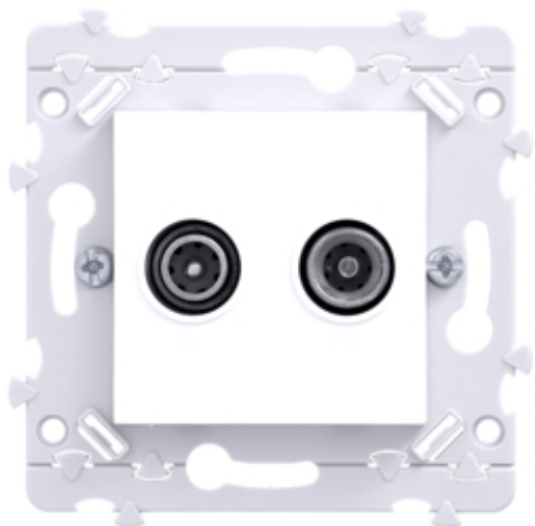
Prise TV+FM directe Essensya à griffes