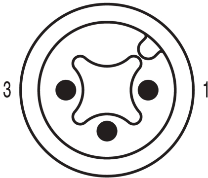
4 Twin male connector