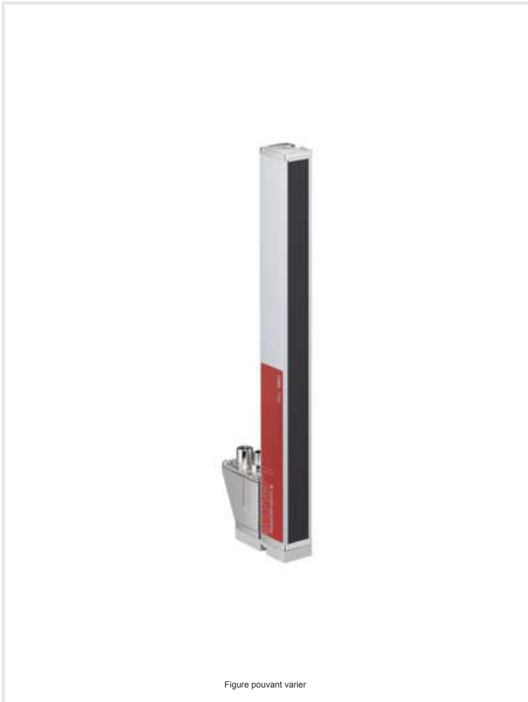
Figure pouvant varier