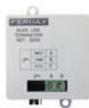
F03255 FIN LIGNE DUOX PLUS