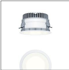
Plafonnier encastré à LED P-INF R200H LED2500-930 LDO WH WH 60818141