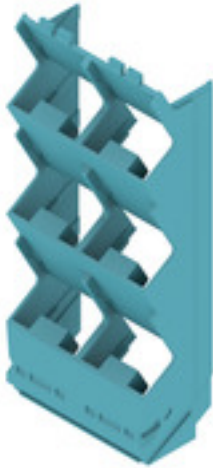
Illustration du produit