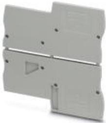
Flasque d'extrémité, Longueur: 74,9 mm, Largeur: 2,2 mm, Hauteur: 36,8 mm, Coloris: gris

Remarque : les données indiquées ici sont tirées du catalogue en ligne. Vous trouverez toutes les informations et données dans la documentation utilisateur. Les conditions générales d'utilisation pour les téléchargements sur Internet sont applicables. ( http://phoenixcontact.fr/download )