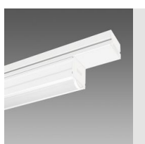
6605 Techno System - diffuseur hémisphérique extensif - CRI 90