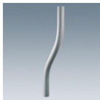
513 Bras courbé pour Aura