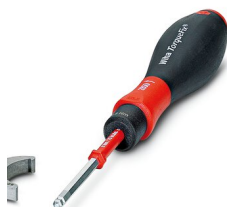
Tournevis dynamométrique, série: RC

https://www.phoenixcontact.com/fr/produits/1607456