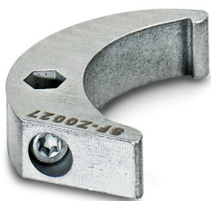
Clé à ergot, série: RC

https://www.phoenixcontact.com/fr/produits/1607455