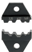
Matrice de rechange pour CRIMPFOX-CX 4,52

https://www.phoenixcontact.com/fr/produits/1212284