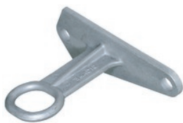
CS 10 W2