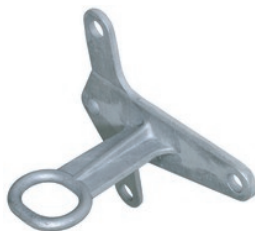
CS 10 W3