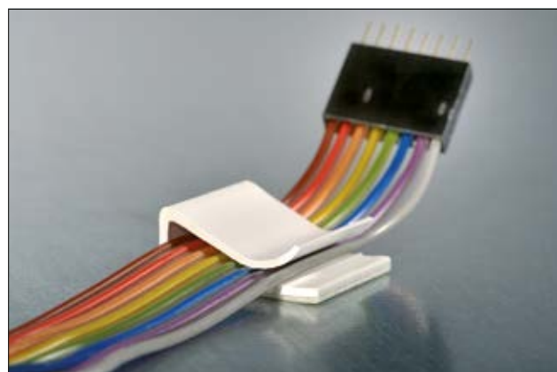
Embase adhésive 130100 pour câbles plats, en application.