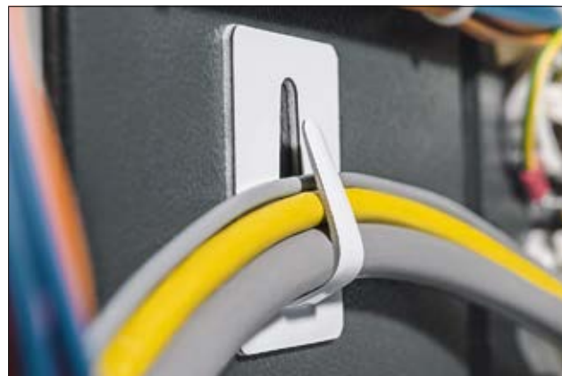
Clip métallique adhésif de la série SAC en application.