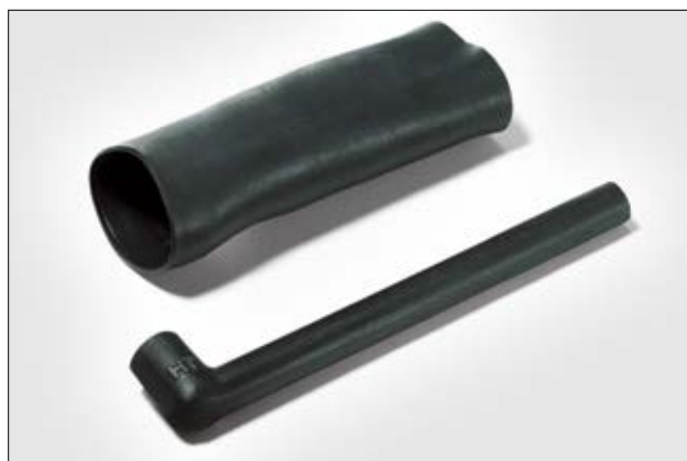
Série 333F322-385, avant et après rétreint.