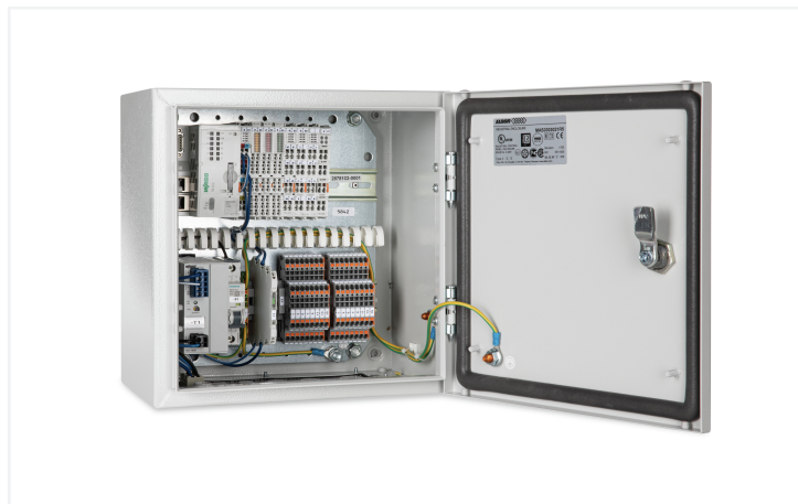
Identique à la figure

Avec la WAGO IoT-Box MES 4G, les machines et les installations peuvent être intégrées facilement et rapidement dans l'Internet of Things (IoT). Le boîtier IoT-Box offre également une multitude de protocoles de communication et de bus permettant de réaliser une communication avec les systèmes de gestion de production. Le système complet est directement prêt à l'emploi et offre toutes les fonctions nécessaires à la digitalisation : de l'acquisition des signaux à la connectivité cloud.