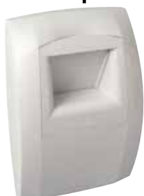
Bahia Curve cuisine

La bouche BAHIA CURVE L permet de garantir l'extraction suffisante et permanente des pollutions intérieures en fonction du taux d'humidité dans la pièce.