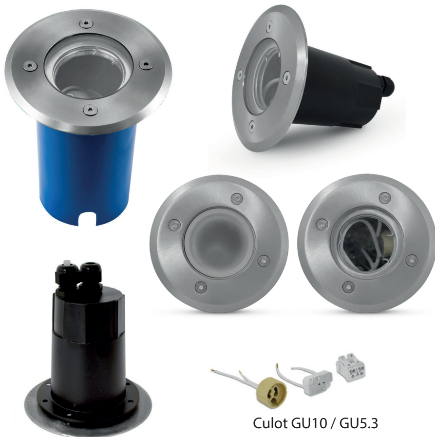
Culot GU10 / GU5.3

Boîtier équipé de deux presse-étoupe pour branchement en parallèle