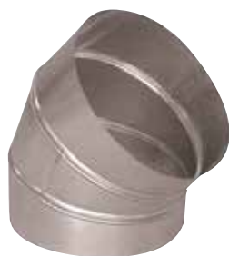
Coude 45° en aluminium

Le coude 45° alu permet de changer la direction d'un réseau aluminium de 45°.