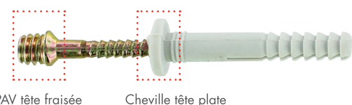
PAV tête fraisée