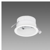
Acc. pour encastrement