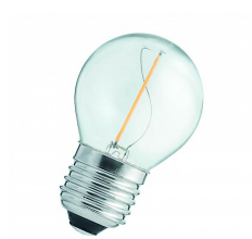
80100038291 LED FIL G45 E27 1W (13W) 110lm 827 Clair