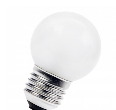
KE775240007F Sphérique E27 G45 240V 7W Dépolie