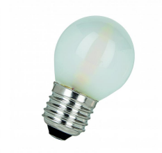
80100038353 LED FIL G45 E27 2W (22W) 210lm 827 Dépolie