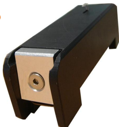
① Outil d'ouverture Home-PACe.