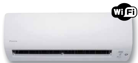
CTXS-K / FTXS-K

NB : sur les modèles CTXS-K et FTXS 20 et 25 K, il faut rajouter une option complémentaire KRP901A