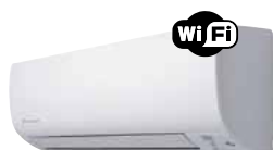
CTXS-K / FTXS-K

Économies d'énergie A++/A+ > Niveau sonore réduit 19 dB(A) > Confort > R-410A