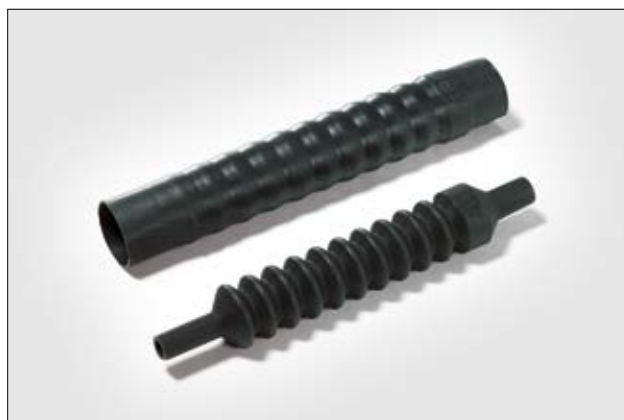
Série 313C722-774, avant et après rétreint.

Pour plus d'informations sur les différents matériaux et adhésifs, voir page 272, 273.