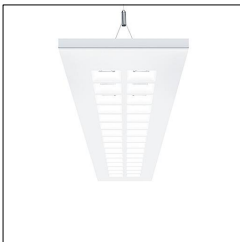
Luminaire suspendu à LED MIRL DI LED3000-830 LDO WH ASQ1 42183052