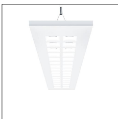
Luminaire suspendu à LED MIRL DI LED3000-830 LDO WH ASQ1 42183052

La présente déclaration de produit environnemental (EPD) est basée selon les normes EN ISO 14025 et EN 15804 et décrit les impacts spécifiques environnementaux du produit mentionné. Cette déclaration fait suite également aux exigences spécifiques et concrètes du programme Institut Bauen und Umwelt e.V. (IBU) selon les règles de calcul des LCA et le contenu de l'EPD (de base) selon les instructions de PCR sous-jacentes (PCR: Règles de catégorie de produit) pour «Luminaires, lampes et composants pour luminaires» (Ref: IBU PCR Teil A et B). Le produit décrit sert d'unité déclarée. La déclaration inclut une description du produit, des informations sur la composition des matériaux, la production, le transport, la phase d'utilisation, l'élimination et le recyclage, ainsi que les résultats de l'évaluation du cycle de vie. Les EPD des produits de construction sont comparables uniquement si les valeurs sont calculées conformément au même PCR et des scénarios d'utilisation appropriés et obligatoires.