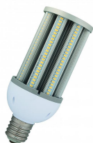
80100036334 LED Corn HOL E40 36W 4860lm 3000K