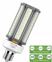
145790 LED Corn Switch E40 36W-54W 4800-7800lm 3000K-5000K