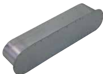
Bouchon Mâle Oblong

Le bouchon mâle oblong permet de boucher la partie terminal d'un réseau oblong dans les locaux tertiaires et logements collectifs.