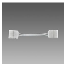
Connecteur pour angle - Strip LED IP20