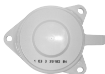
Embase de téléreport G3 Grise (P373)