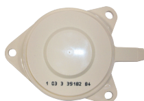
Embase de téléreport G3 Ivoire (P372)