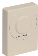
Boîtier de téléreport génération 2 Ivoire (P263)