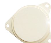
Lot de 5 obturateurs de téléreport ivoires (GC001)