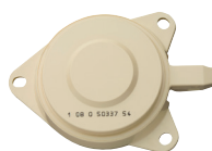
Embase de téléreport ivoire auto-connectable (P278)