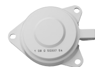
Embase de téléreport grise auto-connectable (P279)