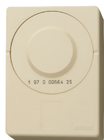
Boîtier de téléreport ivoire auto-connectable (P268)