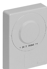
Boîtier de téléreport génération 2 Gris (P264)