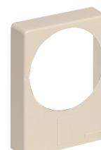
Capot de remplacement pour boîtier ivoire (P266)