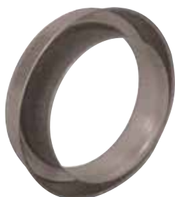
Réduction Plate Concentrique en aluminium

La RPC alu permet de raccorder deux conduits aluminium de diamètres différents entre eux sur un minimum de longueur.