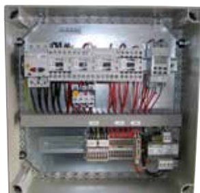
Coffret de désenfumage habitat collectif

Les coffrets de désenfumage parking habitat permettent de piloter les ventilateurs hélicoïdes 2 vitesses pour la ventilation et le désenfumage.