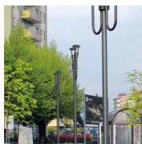
1491 Mât à enterrer