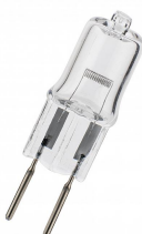
145659 Four GY6.35 12V 50W Clair 300C