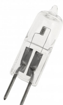
20302530315 ECO GY6.35 12V 40W Clair Axial