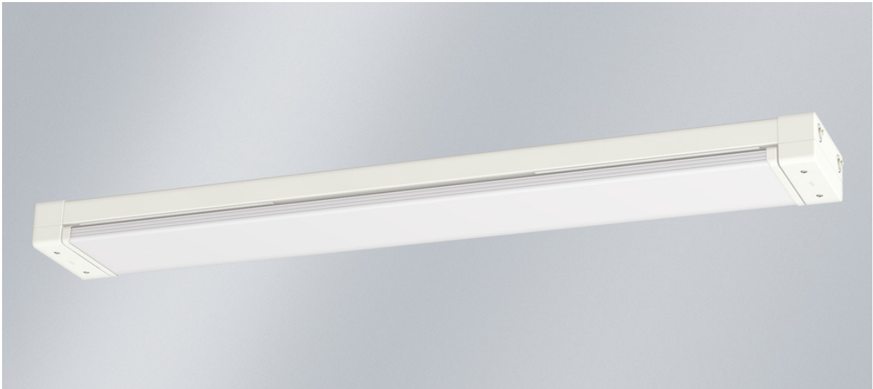
L'illustration peut différer